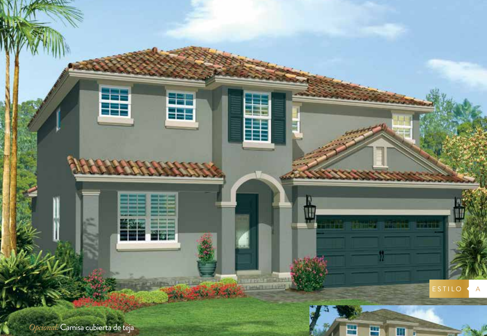
Opcional: Camisa cubierta de teja