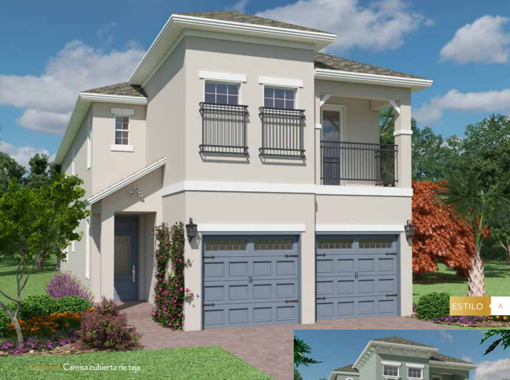
Opcional: Camisa cubierta de teja