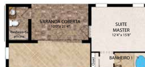
Opção com banheiro piscina