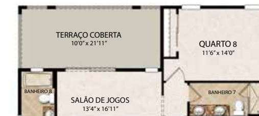
Opção com terraço coberta